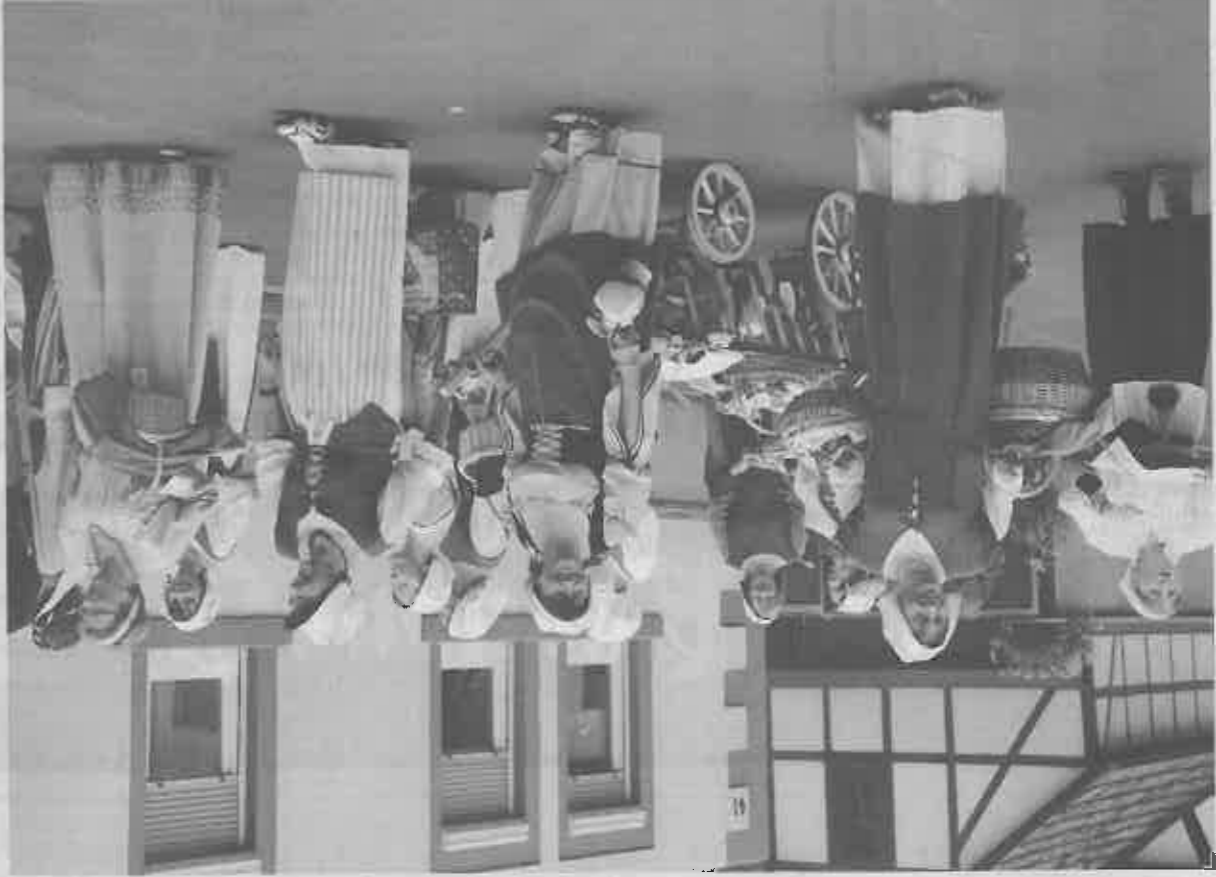
In historischen Gewändern präsentierten sich die Vereine in Ronneburg.