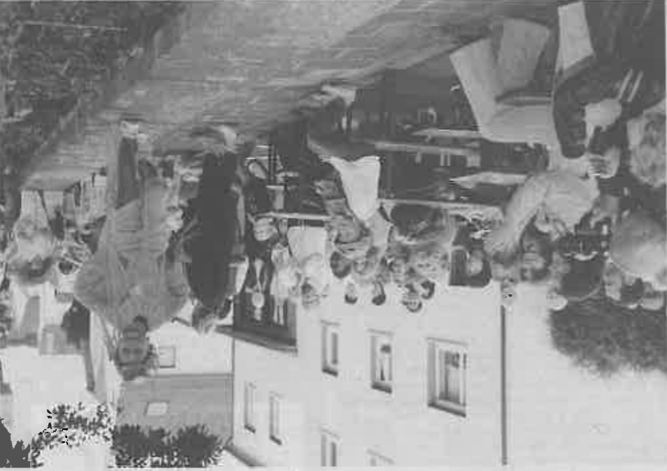
Die Topmodells der Kita zeigten auf dem Lautsteg fantastische Mode.

Teil der Lang- und Kirchstraße sowie der alte Pfarrgarten bildeten die Bühne für die zahlreichen Akteure. Mehr als 20 Vereiner und private Gruppen beteiligten sich an der historischen Korb, Zahlreiche Hofreiten wurden schon herausgeputzt und präsentierten sich dem Besucher euphorisch und jubelten den Fahrern zu. Auch Bürgermeister Habermann zeigte sich begeistert von der tollen Stimmung