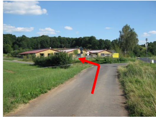
Kurz vor dem Bauernhof links abbiegen.