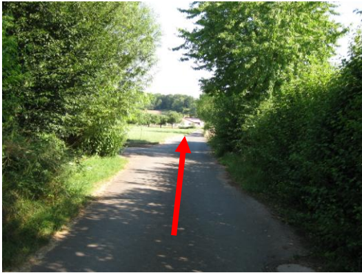
Dem Weg zwischen Land- und Wingertstraße folgen.