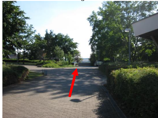
Geradeaus zum Haupttor des Jugendzentrums gehen.