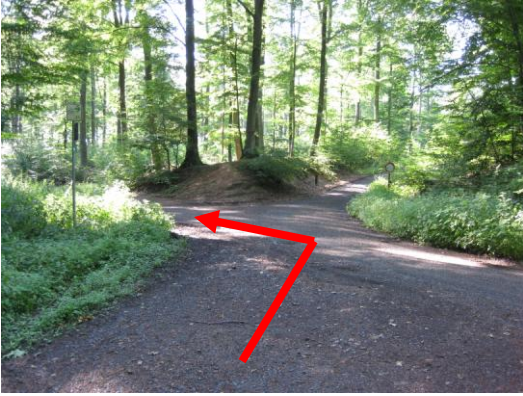
An der ersten Kreuzung im Wald links abbiegen.