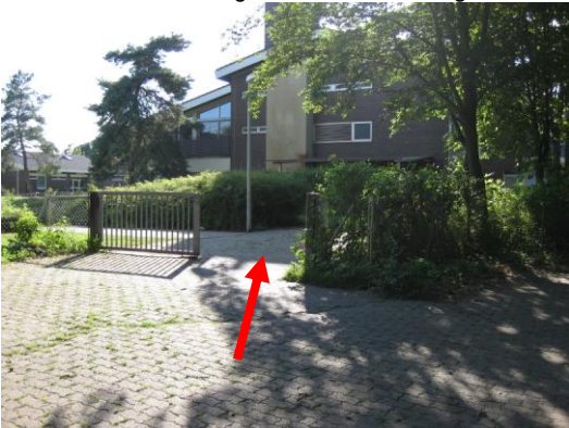
Kurz darauf durch das Tor in das Jugendzentrum gehen.