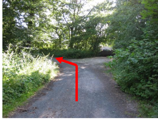
Am Jugendzentrum dem Weg nach links folgen.