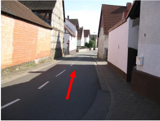
Beginn der Wanderung an der Gaststätte „Zum Deutschen Hof“. Nach rechts in die Hanauer Straße.