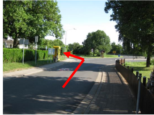
Am Ortsausgang Neuwiedermuß links abbiegen.