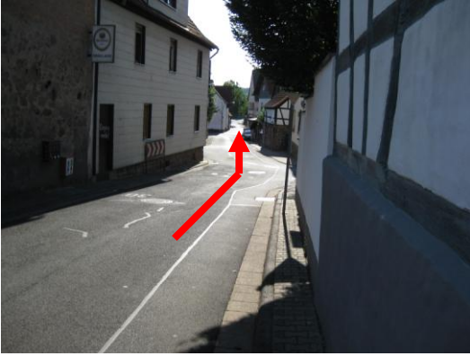
Geradeaus zurück zum Ausgangspunkt.