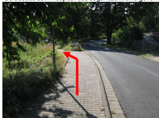
Kurz danach dem Fußweg halblinks bergab folgen.