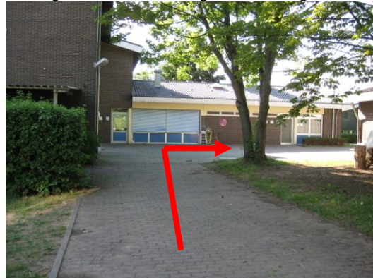
Gleich danach rechts abbiegen.