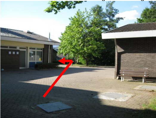
Kurz danach gleich wieder links abbiegen.