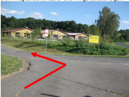
Die gleiche Stelle noch einmal aus der Nähe.